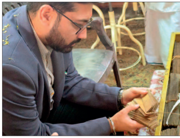
हरिभूमि न्यूज ॥ महासमुंद